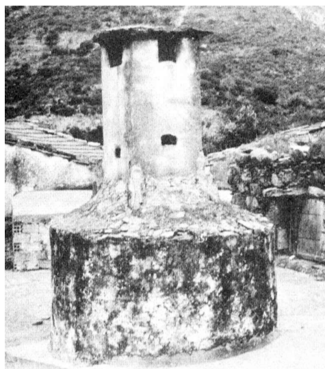
Λεπτή η καπνοδόχος πάνω στο κυλινδρικό βαρύ βάθρο της εδώ, κοπάζει καχύποπτα τους καιρούς, με τ' άρμπνα μάτια της. Μένει στο Μετόχι του Πελεκάνου....