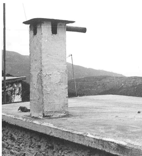
Ανηφοράς στα Μπουλταδιανιά - Καμπανού. Θαρρείς και σημαδεύει τη... Σούγια

“Αφόριον είναι το γυαλί και σφάκελα ντ' απου 'πε, κι η μουζουδιά τ' απόμεινε, κι ο νταμουλάς που του 'ρθε”.