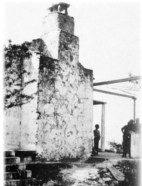
Πόσα σκαλοπάτια πρέπει ν' ανέβεις για να φτάσεις στα ύψη... Αν απ' εκεί πάνω μας θωρείς τουλάχιστο σαν και πρώτα, χαλάλι... Είναι στο Μπαμπακάδο - Καντάνου.