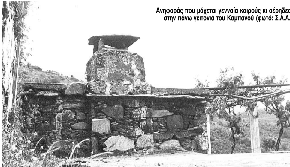
Ανηφοράς που μάχεται γενναία καιρούς κι αέρηδες, στην πάνω γειτονιά του Καμπανού

Μαντινάδες ατέλειωτες, που ανάβουν φωτιές θεόρατες στις καρδιάς τα φύλλα, με τους σεβντάδες και τα ντέρτια που τραγουδούν, με της αγάπης τα πάθια τα αιώνια, που ψάλλουν!