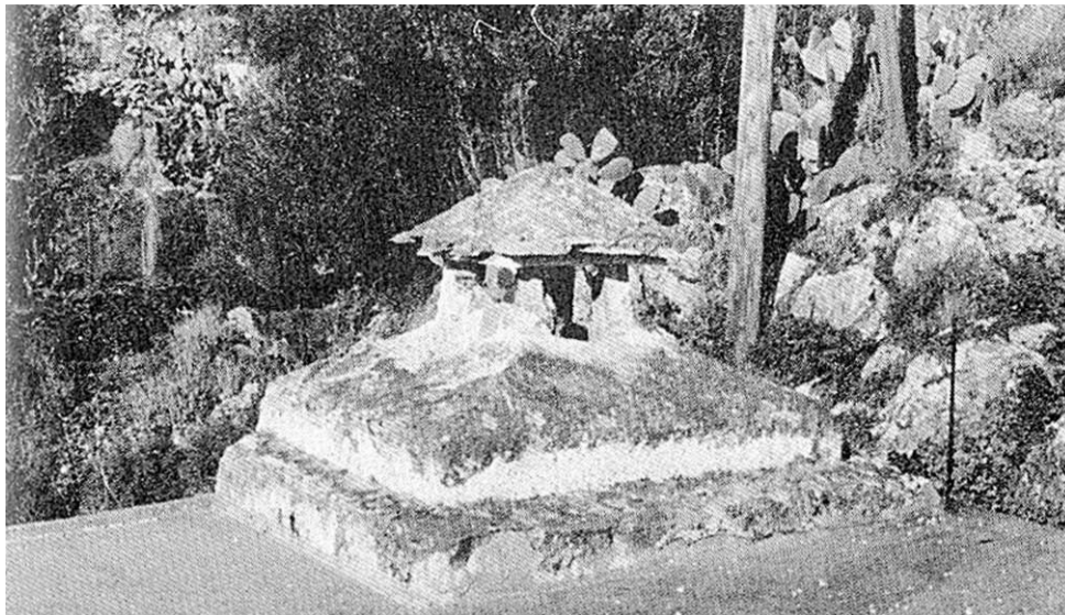
Βαριά κι αμετακίνητη η καμινάδα με τον ανηφορά της, εδώ, νιώθει περήφανη στα χτιστά βάρρα της.

πυροφύτιλο, το: συνώνυμο με το προηγούμενο.