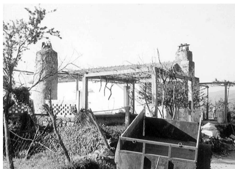
3. Ανηφοράδες στο Μπαμπακάδω Καντάνου κι η κρεβατίνα.. με την αυλή!