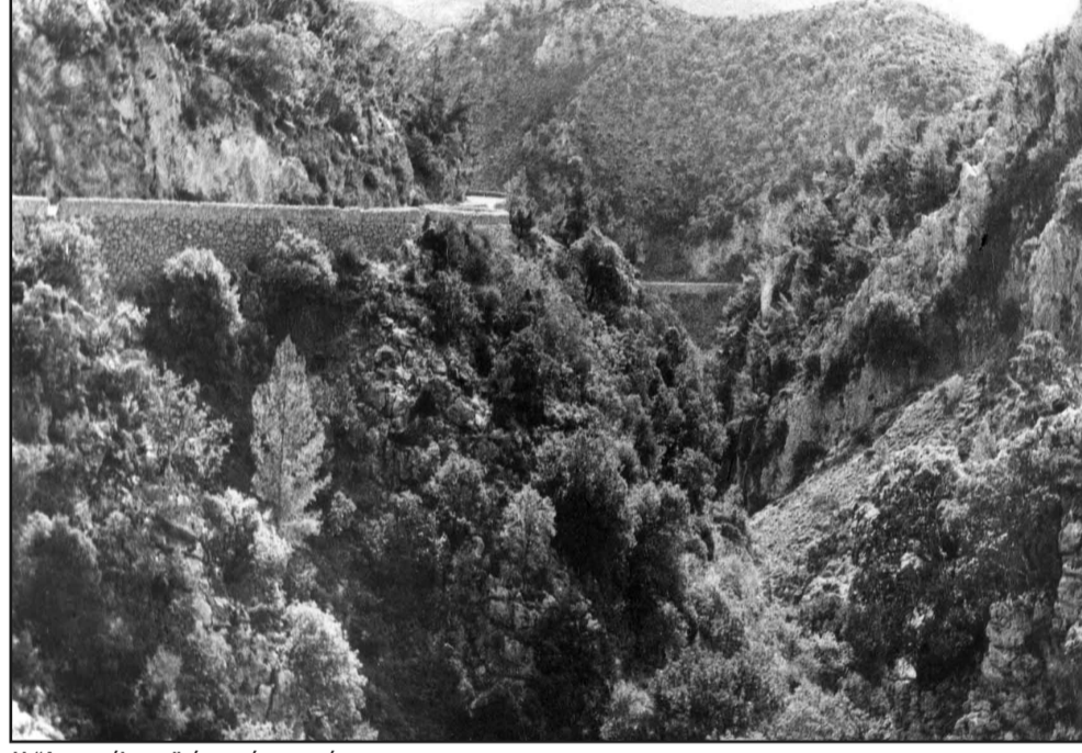
Η "Αγριομέλισσα" όπως ήταν... κάποτε.

τας ψυχάς του Κρητικού λαού και οι υπερήλικες πατέρες ή οι έφηβοι αδελφοί των εις το μέτωπον δεινώς δοκιμαζόμενων ηρώων μας έσπευσαν να παραδώσουν, οι πλείστοι, τα εις την κατοχήν των ευρισκόμενα εύρηστα όπλα μετά των πυρομαχικών, μόνον η Επαρχία Σελίνου παρέδωκε 364 εύρηστα όπλα με ανάλογον αριθμόν πυρομαχικών.